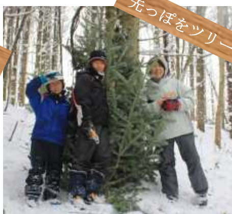
先っぽをツリーに