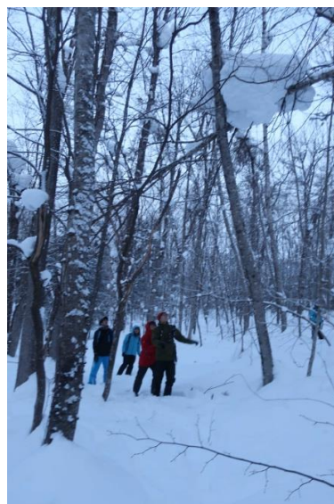
2月19日 酪農学園大学 森林勉強会【森林実習】