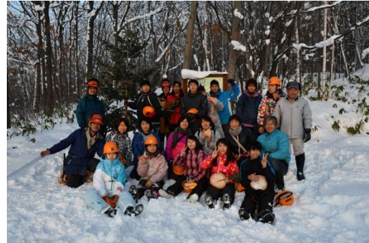
12月10日 間伐体験クリスマスツリーのおすそ分け