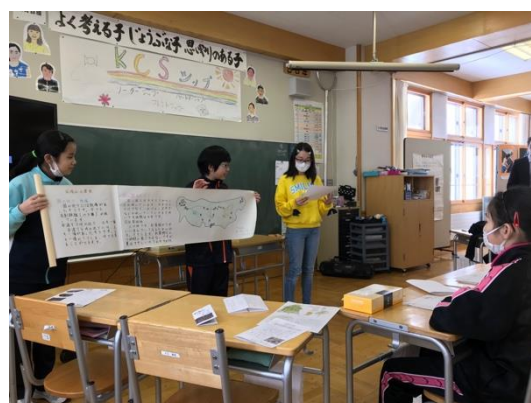
2月23日 近二小5・6年 突哨山活動まとめ発表会