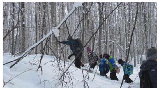
2月14日 近二小1・2年突哨山活動