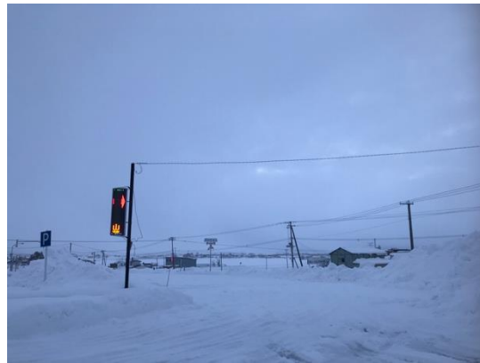
12月29日 突哨山駐車場除雪